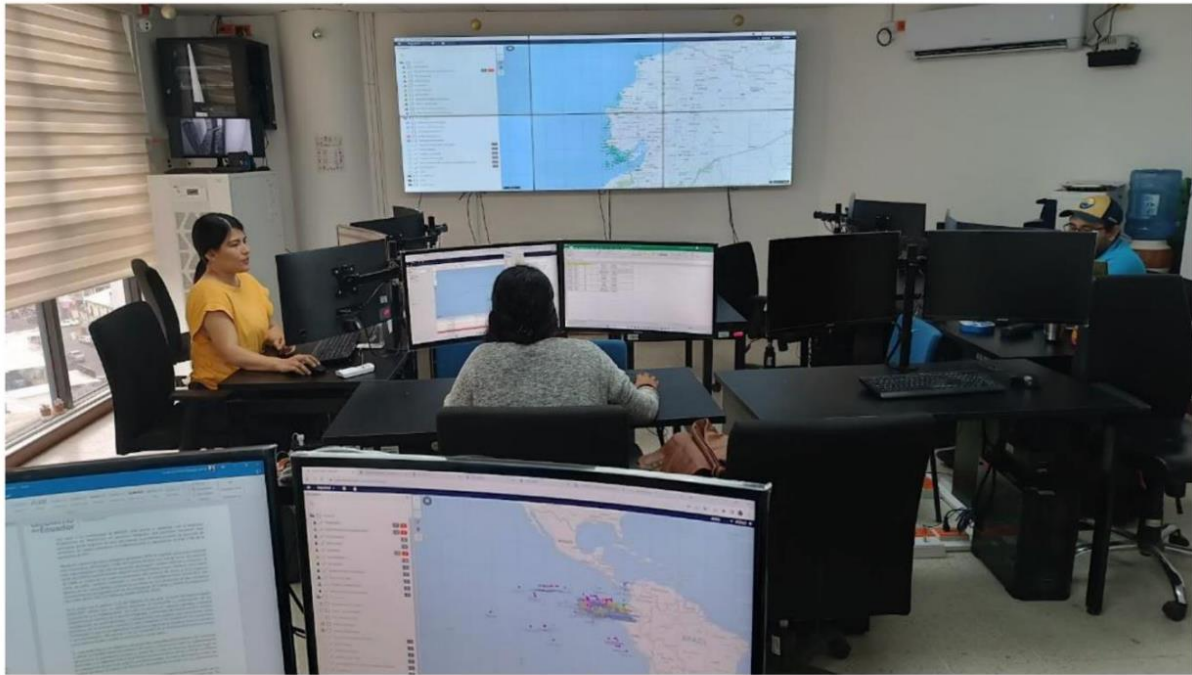
Operadores del CMS, distribuidos en turnos rotativos de 8 horas durante los 365 días del año